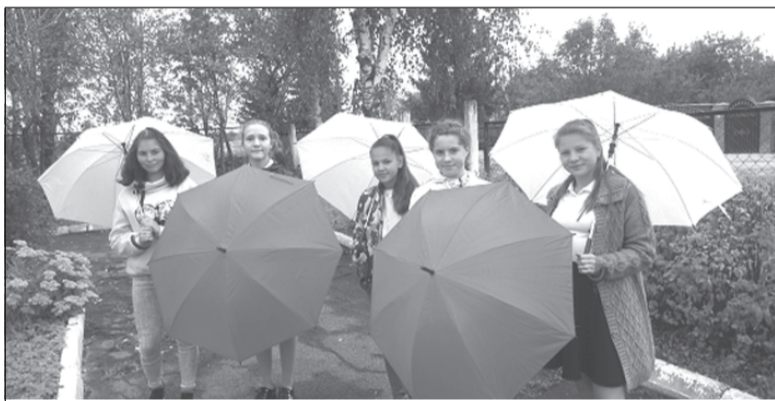
Им дожди - не страшны!

Наступила осень, а вместе с ней пришли и дожди. Но нашим ребятам они не страшны. Теперь у них есть красивые яркие зонтики, подаренные им за активное участие в культурно-массовых мероприятиях и в жизни села Ингарь.