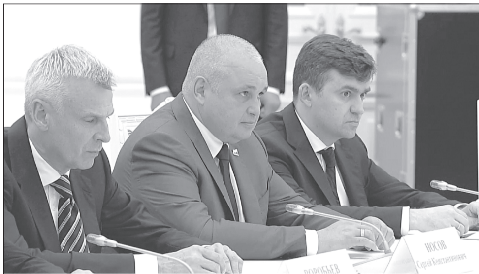
Избранный глава региона Станислав Воскресенский на встрече с Президентом в Кремле.

Ваша задача как избранных глав субъектов Федерации – услышать эти сигналы, которые люди передали власти, разобраться в существующих проблемах, ещё глубже разобраться, понять их и ответить на запросы и ваших сторонников, и, что важно, граждан, которые поддержали других кандидатов. Не закрываться от тех, кто имеет иную