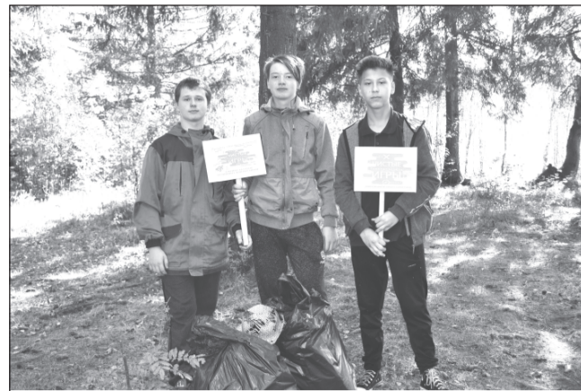
«Ястребы» со своей добычей.

Благодарим всех, кто принял участие в субботнике и внес свой вклад в благоустройство нашего родного города!