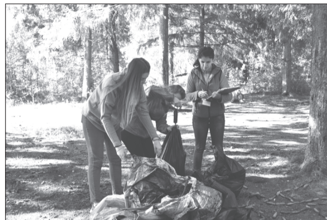
Чей мешок тяжелее?