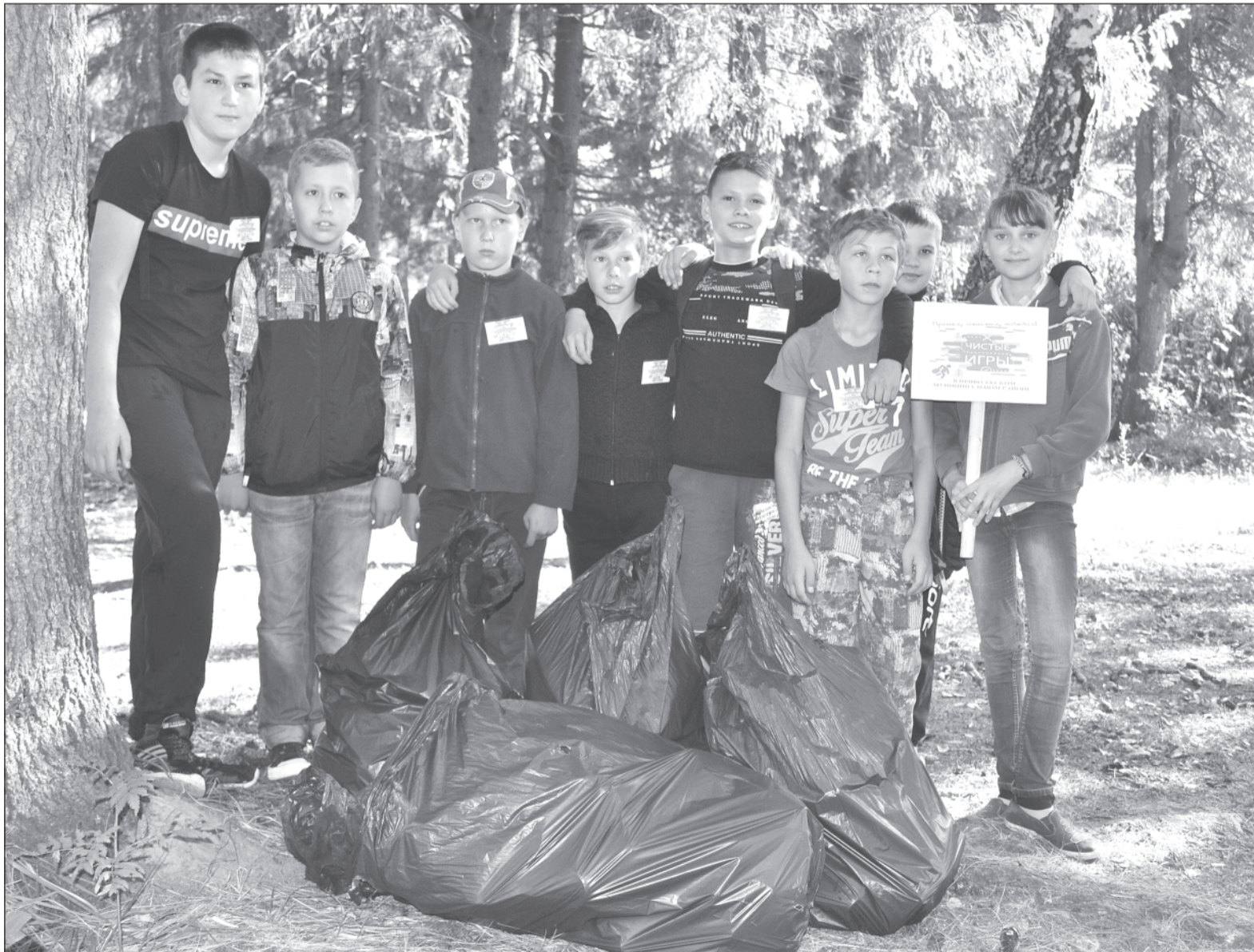
Ребята из клуба «Родина» со своей работой справились!

Наша газета делала анонс об этом мероприятии, а теперь пришла очередь рассказать, как всё было, хотя вступление в текст уже сделано.