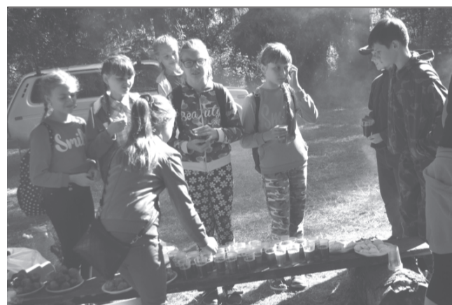
Горячий чай для подкрепления сил.