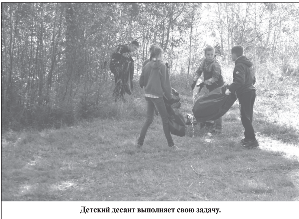
Детский десант выполняет свою задачу.