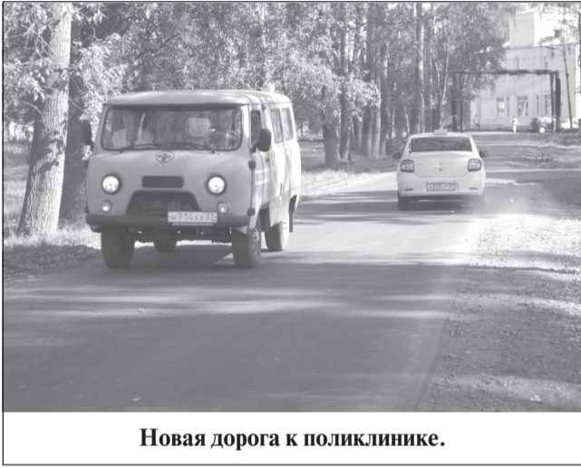
Новая дорога к поликлинике.

Наверное, уже многие жители города и района имели возможность оценить результаты капитального ремонта дороги на территории Приволжской ЦРБ.