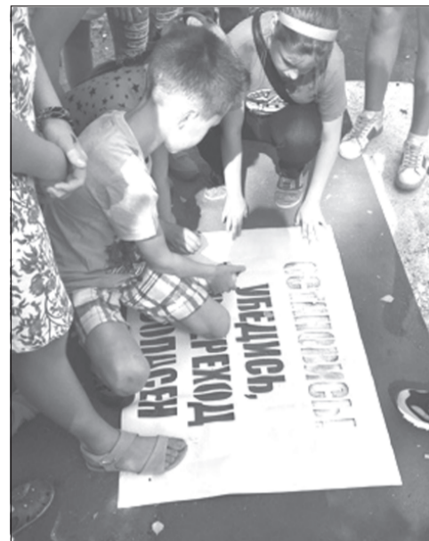
Напомнить об осторожности - не лишнее.

С началом учебного года поток пешеходов на пешеходных переходах вблизи образовательных учреждений существенно увеличился, большинство пешеходов - это школьники.