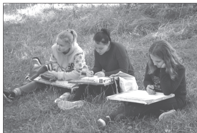
Кто танцует, а кто - рисует...